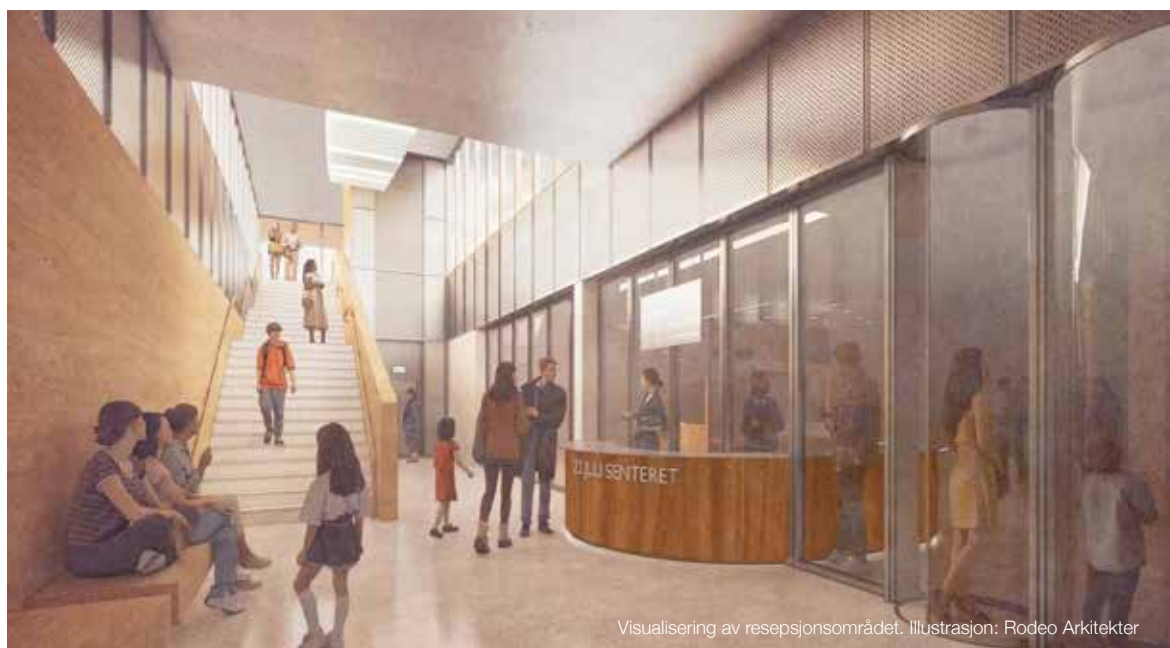
Visualisering av resepsjonsområdet. Illustrasjon: Rodeo Arkitekter

Støttegruppens styre hadde i løpet av oktober og november møter med alle tre finalekandidater for å få presentert tanker, gi mulighet til å svare på spørsmål og å kunne bidra med innspill.